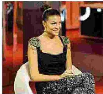
Bellezza Cristina Chiabotto