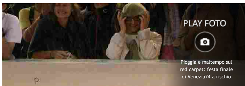
Pioggia e maltempo sul red carpet: festa finale di Venezia74 a rischio

PER APPROFONDIRE: festival di venezia, lido, mostra del cinema, mostra del cinema., venezia74